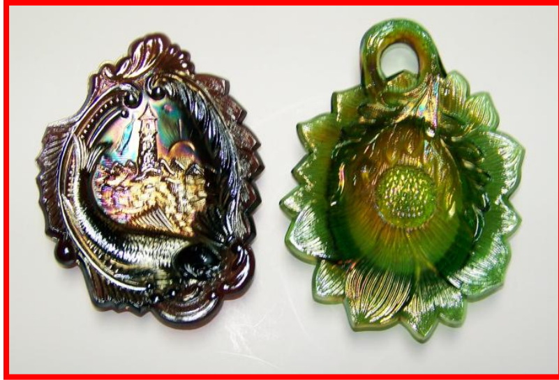
Seacost tray & Sunflower tray