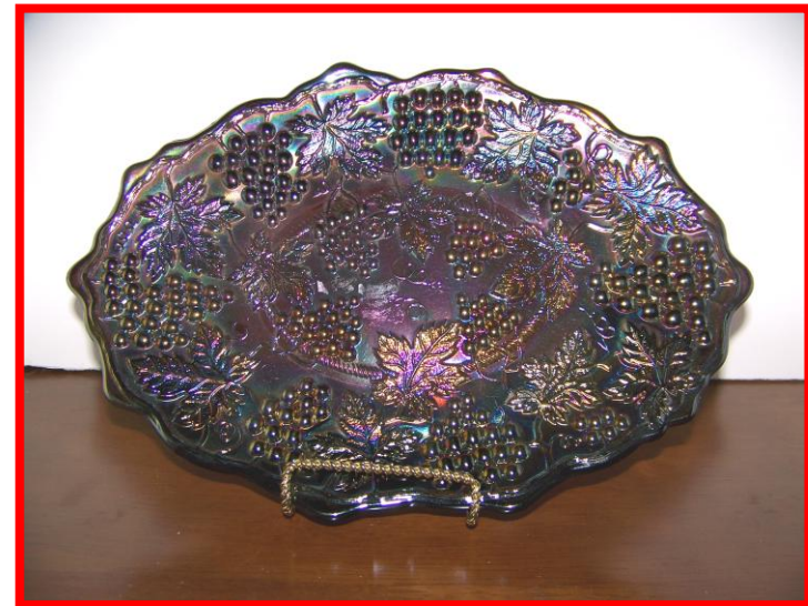
Grape & cable dresser tray