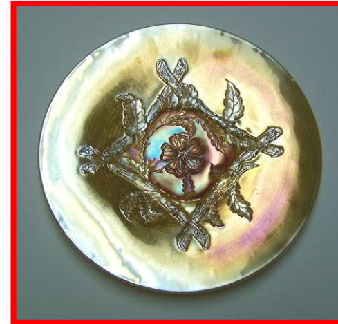
APPLE BLOSSON TWIG

Once this plate has a handgrip shape, it has dimensions that vary between 8 and 10 inches. In summary, until now the Dugan dishes are affordable. Nevertheless, the plate shape is increasingly sought after by collectors.