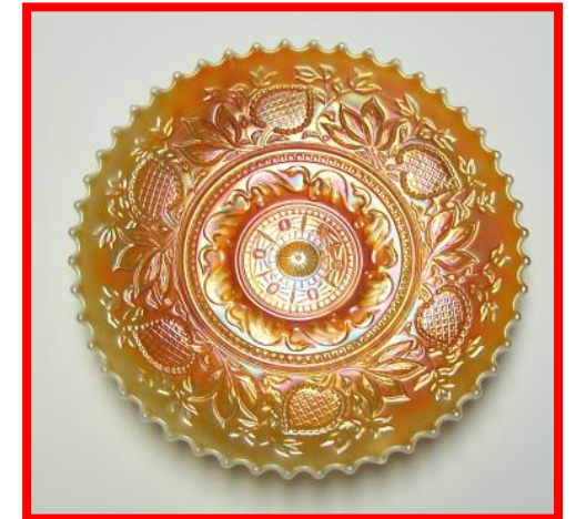
DOUBLE STEM ROSE