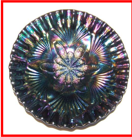
PETAL & FAN