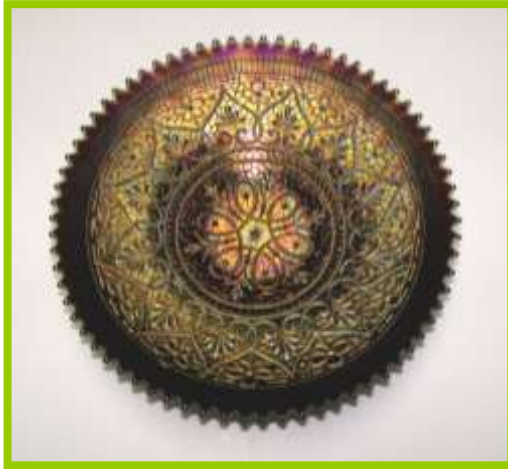
HEART & FLOWERS