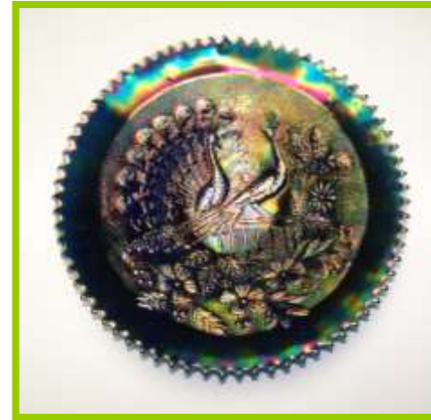
PEACOCK AT THE FENCE