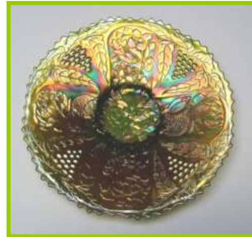
LOTUS & GRAPE