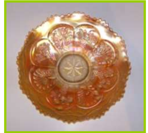
PEACOCK & GRAPE